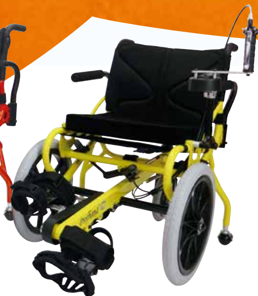
ソリッドイエロー