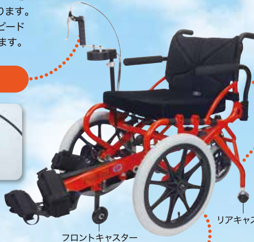
フロントキャスター