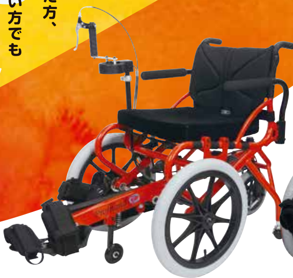
イタリアンレッド